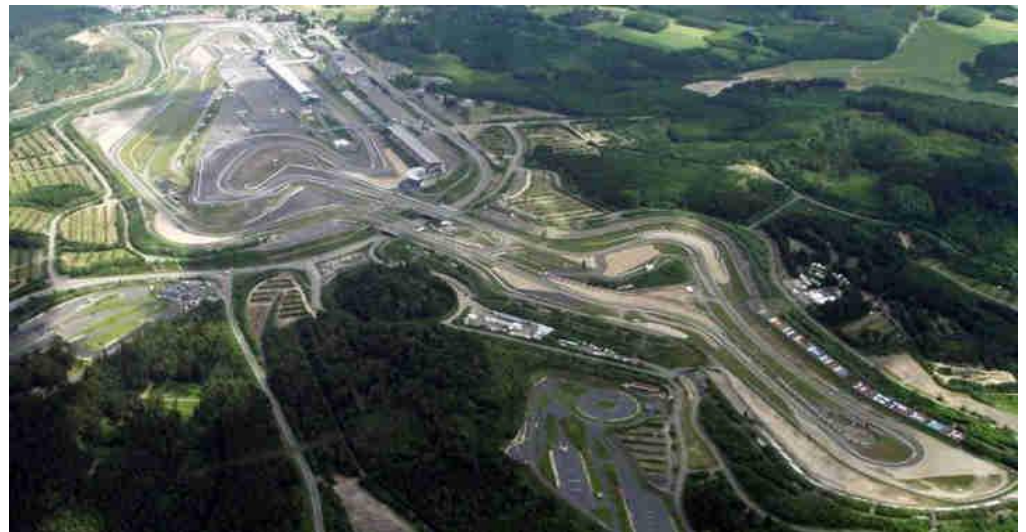
从空中俯瞰南环（照片左上角则是北环的一角）

纽博格林赛道原本拥有四种的路线配置：最长的“全路线”（Gesamtstrecke）长达 28.265 公里，但它经常被拆分为被称为“北环”的北跑道（长 22.810 公里）与被称为“南环”的南跑道（长 7.747 公里）。